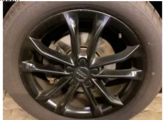
Beschädigung 14: Rad/Reifen: Felgensatz komplett - abweichend Auslieferungszustand - erneuern