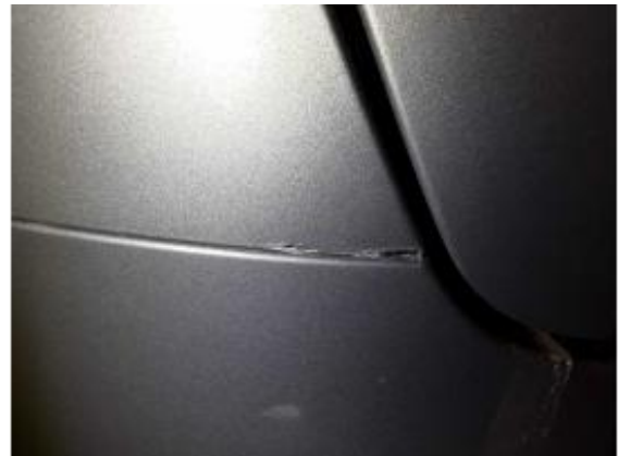
Beschädigung 1: Seitenwand links: Seitenwand - Kratzer - auslegen / polieren