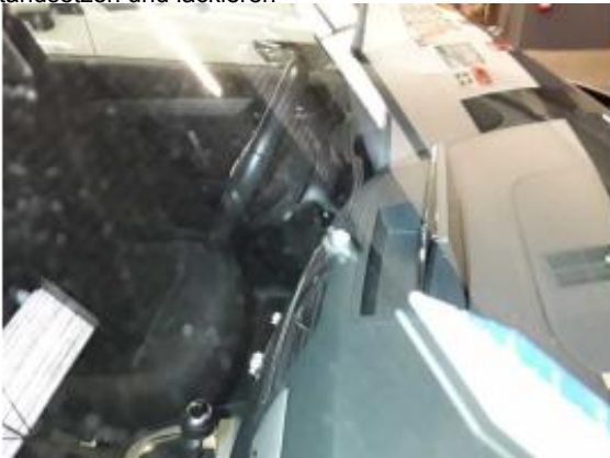
Beschädigung 13: Verglasung: Frontscheibe - Steinschlag - erneuern