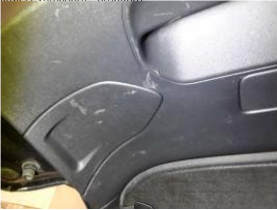
Beschädigung 6: Heckklappe/-tür: Verkleidung Standard unten - verkratzt / verschürft - erneuern

unten - verkratzt / verschürft - erneuern