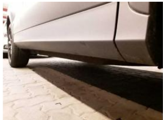
Abbildung 24: Schweller