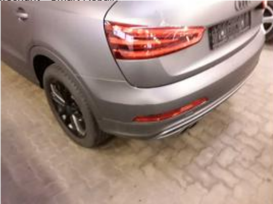
Beschädigung 10: Stossfänger hinten: Stossfänger hinten - verkratzt / verschürft - lackieren