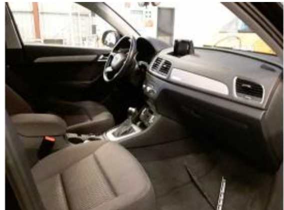
Abbildung 12: Innenraum