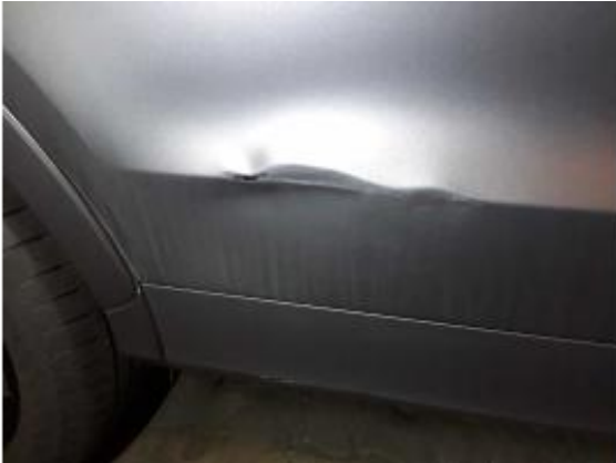
Beschädigung 12: Tür hinten rechts: Tür - Delle / Lackschaden - instandsetzen und lackieren