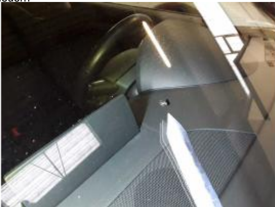
Beschädigung 13: Verglasung: Frontscheibe - Steinschlag - erneuern