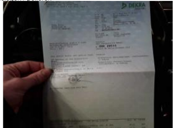
Beschädigung 4: Sonstiges: Hauptuntersuchung - fällig - erneuern