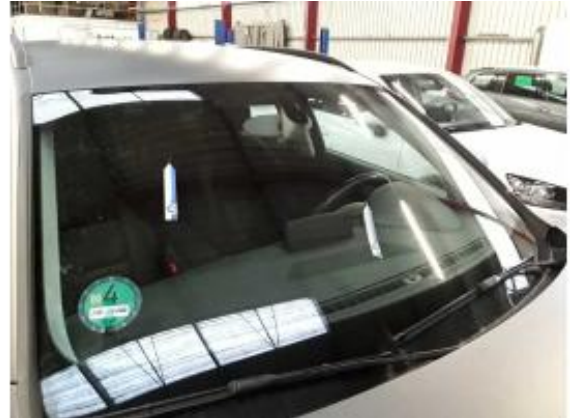
Beschädigung 13: Verglasung: Frontscheibe - Steinschlag - erneuern