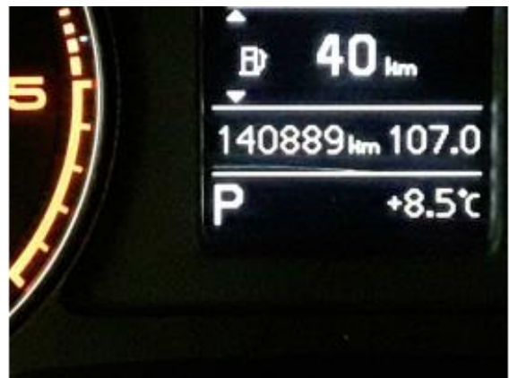
Abbildung 6: Innenraum