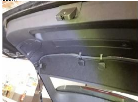
Beschädigung 6: Heckklappe/-tür: Verkleidung Standard