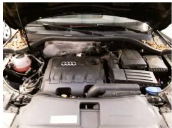
Abbildung 14: Sonstiges