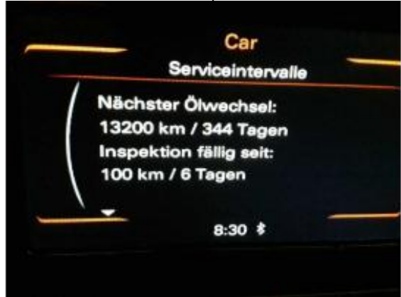
Beschädigung 9: Sonstiges: Inspektion/Wartung (Ohne Ölwechsel) - fällig - erneuern