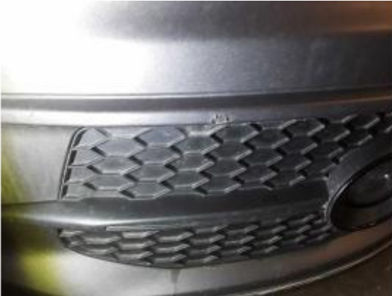
Beschädigung 7: Stossfänger vorn: Stossfänger vorn - verkratzt / verschürft - Smart Repair