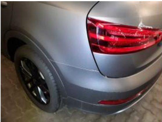
Beschädigung 1: Seitenwand links: Seitenwand - Kratzer - auslegen / polieren