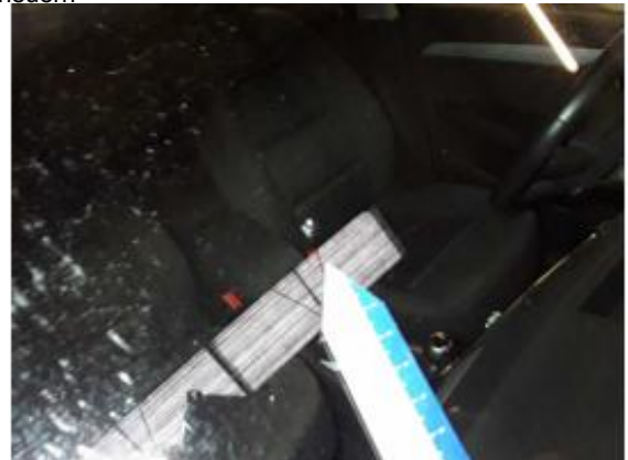
Beschädigung 13: Verglasung: Frontscheibe - Steinschlag - erneuern