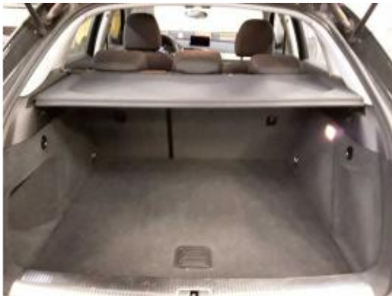
Abbildung 11: Innenraum