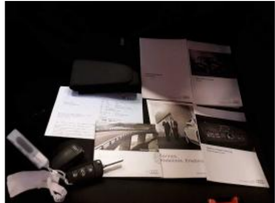
Abbildung 20: Fahrzeugdokumente