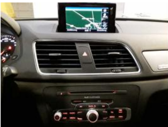
Abbildung 7: Innenraum