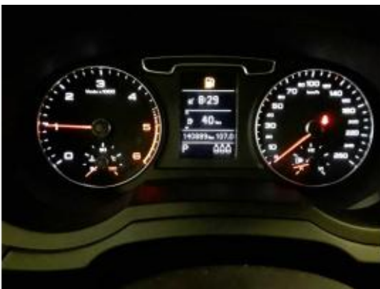
Abbildung 5: Innenraum