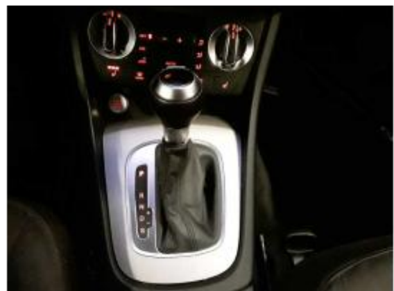
Abbildung 8: Innenraum