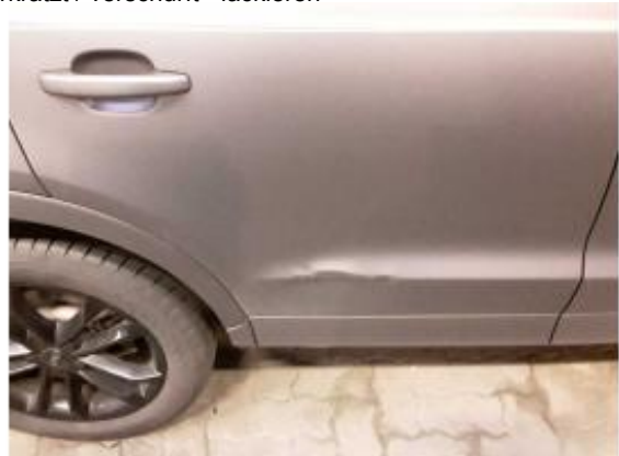
Beschädigung 12: Tür hinten rechts: Tür - Delle / Lackschaden - instandsetzen und lackieren