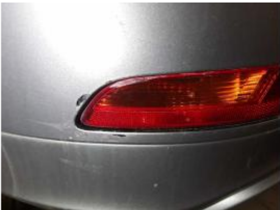
Beschädigung 5: Stossfänger hinten: Rückstrahler links -