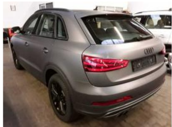
Abbildung 4: Schräg hinten