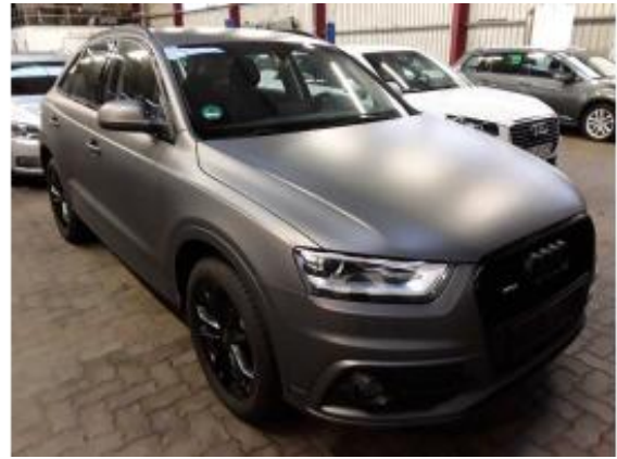
Abbildung 2: Schräg vorne