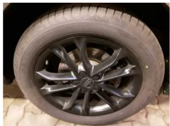
Abbildung 16: Räder/Reifen