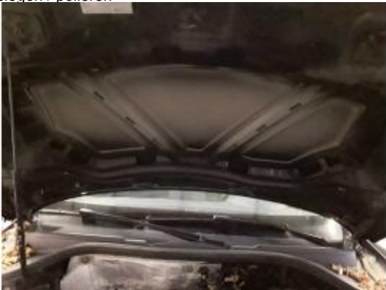
Beschädigung 3: Motorhaube: Dämmmatte - fehlt - erneuern