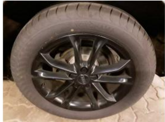
Abbildung 18: Räder/Reifen