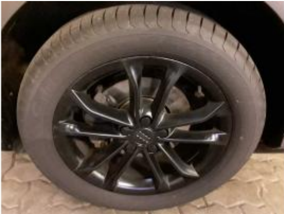
Abbildung 19: Räder/Reifen