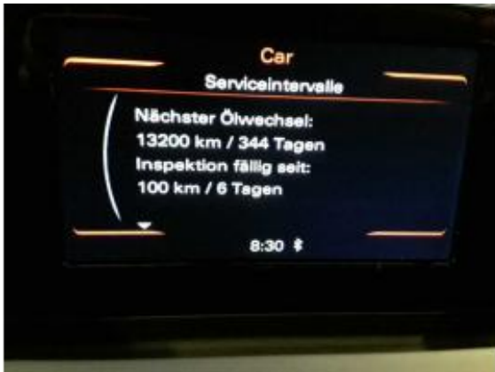
Abbildung 9: Innenraum