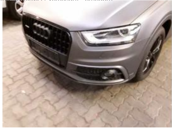
Beschädigung 7: Stossfänger vorn: Stossfänger vorn - verkratzt / verschürft - Smart Repair

unten - verkratzt / verschürft - erneuern