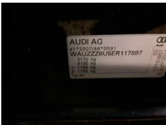
Abbildung 15: FIN / Typenschild