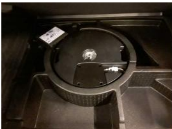
Abbildung 13: Sonstiges