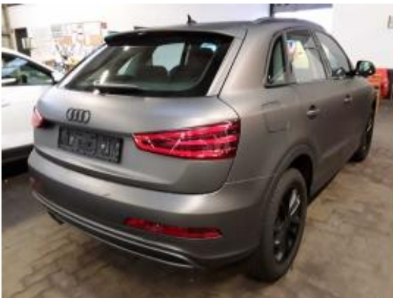
Abbildung 3: Schräg hinten