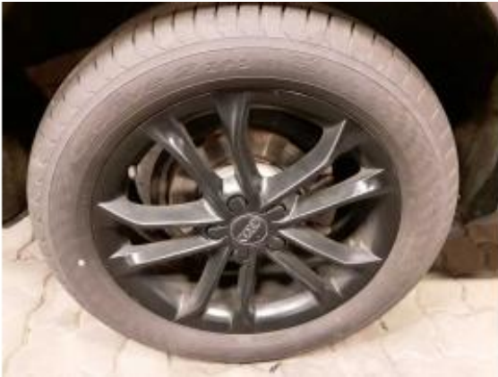
Abbildung 17: Räder/Reifen