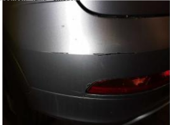
Beschädigung 10: Stossfänger hinten: Stossfänger hinten - verkratzt / verschürft - lackieren