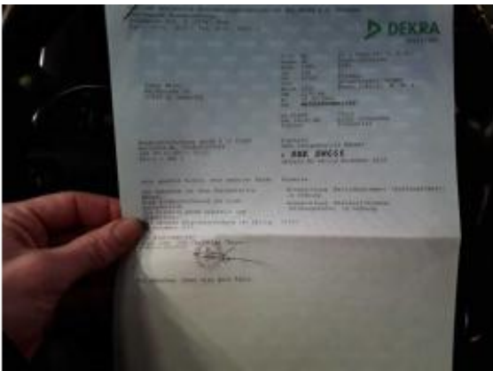
Abbildung 21: Fahrzeugdokumente