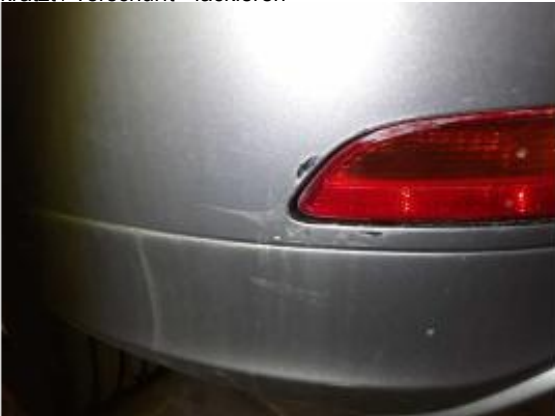
Beschädigung 10: Stossfänger hinten: Stossfänger hinten - verkratzt / verschürft - lackieren