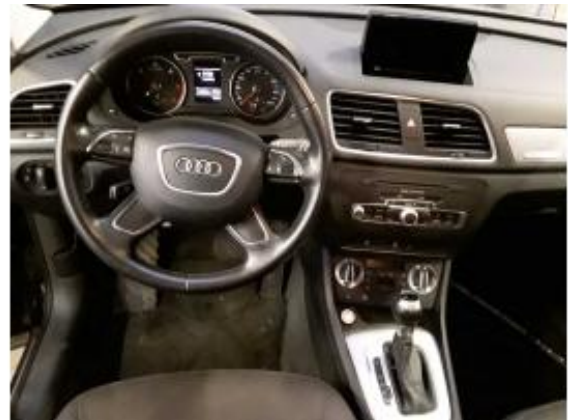
Abbildung 10: Innenraum