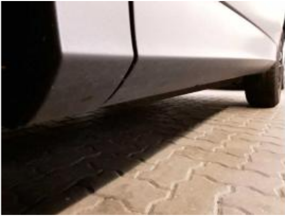
Abbildung 25: Schweller